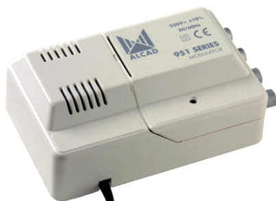
MD-410 / 310

Modulateur TV avec audio mono, qui à partir des signaux audio et vidéo génère un canal de TV analogique. Le canal généré se multiplexe avec le reste des canaux de l'installation de TV. Disponible en différentes bandes, normes et tables de canaux.